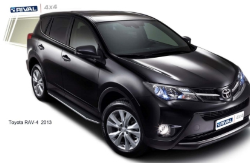
Toyota RAV-4 2013

Перед установкой изделия необходимо убедиться, что автомобиль, на который планируется установка, соответствует модельному ряду, указанному в настоящей инструкции. В случае затруднений с определением соответствия обращайтесь службу технической поддержки supp@rivalauto.com . В случае наезда на препятствие необходимо убедиться в отсутствии повреждений и агрегатов автомобиля и пригодности дальнейшей эксплуатации порогов. При правильной установке пороги не должны касаться узлов и агрегатов автомобиля. Производитель вправе вносить изменения в конструкцию порогов.