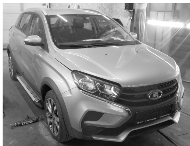
Общий вид автомобиля с порогом

Перед установкой изделия необходимо убедиться, что автомобиль, на который планируется установка, соответствует модельному ряду, указанному в настоящей инструкции. В случае затруднений с определением соответствия обращайтесь службу технической поддержки supp@rivalauto.com . В случае наезда на препятствие необходимо убедиться в отсутствии повреждений и агрегатов автомобиля и пригодности дальнейшей эксплуатации порогов. При правильной установке пороги не должны касаться узлов и агрегатов автомобиля. Производитель вправе вносить изменения в конструкцию порогов.